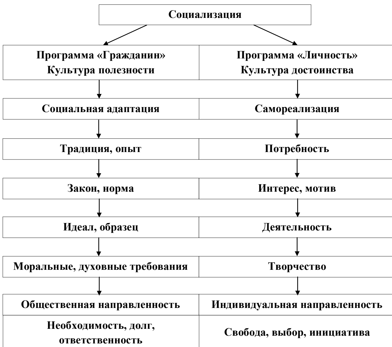
Рис. 2. Социальная адаптация с выходом на воспитательный результат

В подобной противоречивой методологической ситуации воспитатели-практики сожалеют по поводу отрицательных последствий несбалансированности и противоречивости рекомендуемых подходов к процессу воспитания,